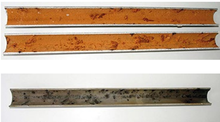
Abbildungen 1 + 2: Typisches Schadensbild einer Lochkorrosion, vor (oben) und nach (unten) Entfernung der Deckschicht.