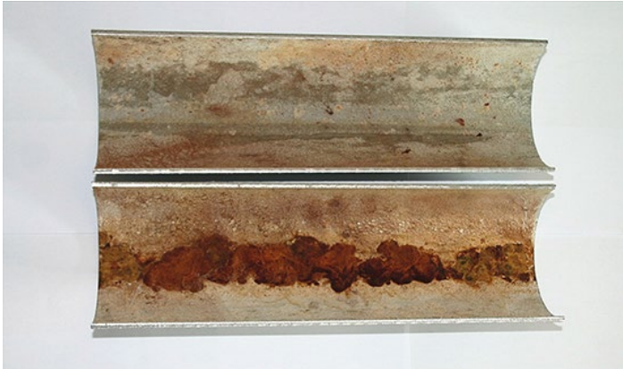
Abbildung 4: Partikelinduzierte Lockkorrosion in 6-Uhr-Lage.